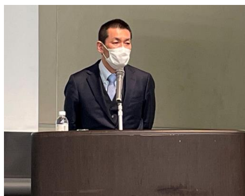
芝田課長補佐による講演