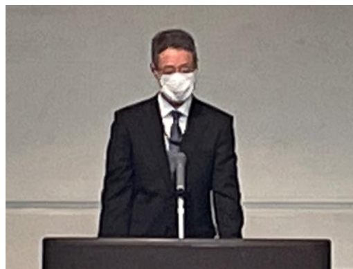
来賓挨拶：河合組織犯罪対策局長