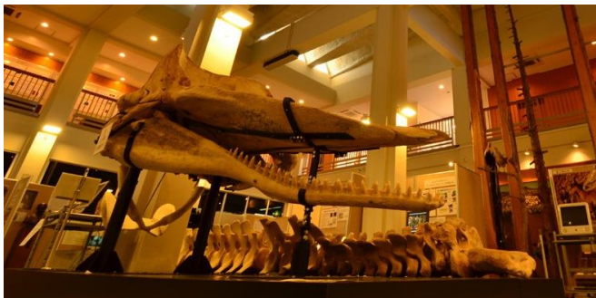
名古屋大学博物館

・住所、参加希望者全員のお名前とお子様の学年、メールアドレス、電話番号を記載の上、5月15日（月）までに日本損害保険協会中部支部宛てにメール（nagoya@sonpo.or.jp）でお申し込みください。