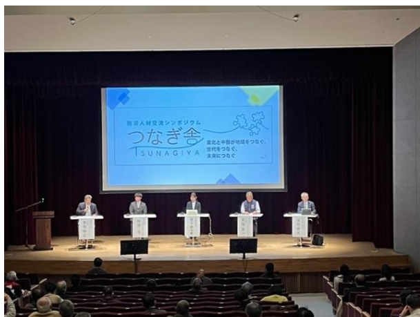
<パネルディスカッションの様子>

当支部では、地域の防災力を高めるため、今後も防災・減災啓発活動を進めていきます。