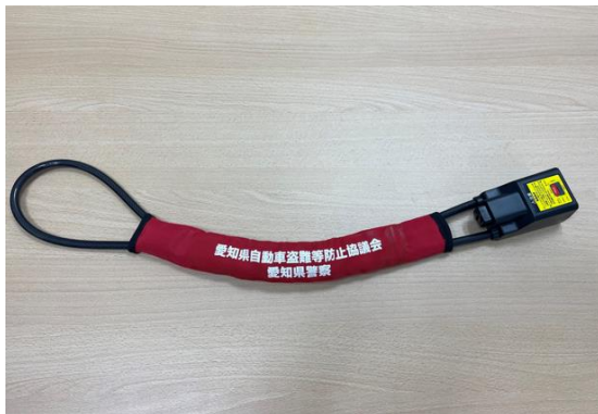
メタルワイヤー式ハンドルロック