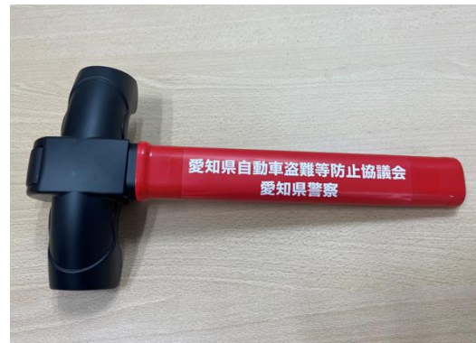
T字型ハンドルロック