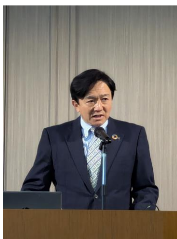
開会挨拶をする川杉支部委員長