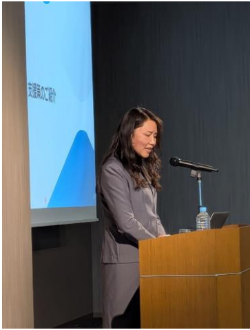
中部経済産業局 経営支援課 石川課長補佐