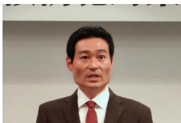
谷幹事の活動報告