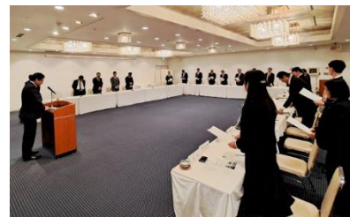
決議文採択の様子