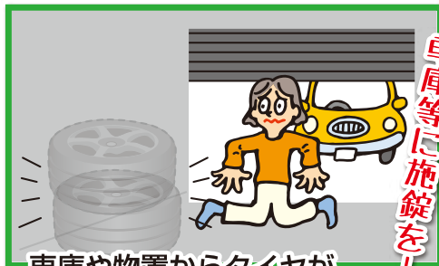
車庫や物置からタイヤが盗まれるケース