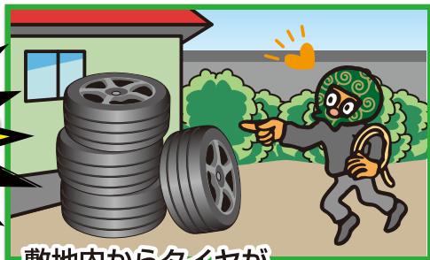
敷地内からタイヤが盗まれるケース