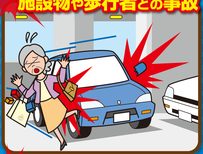
施設物や歩行者との事故