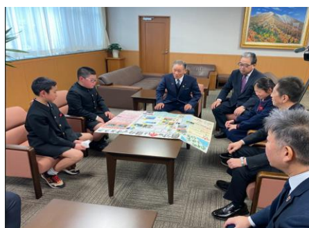
油野市長（中央）との懇談