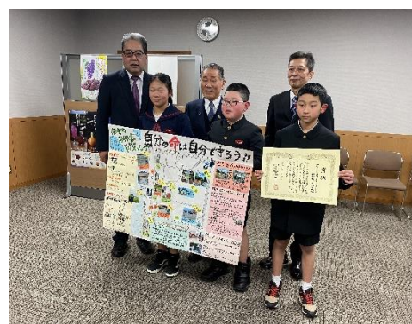
油野市長（中央）と受賞児童の記念撮影