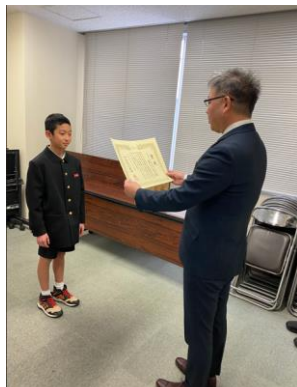
高口委員長（右）から賞状の授与