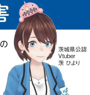
茨城県公認 Vtuber 茨ひより

台風等の影響により大雨が発生すると河川の氾濫や土砂災害が発生しやすく、家屋の流失、土砂への埋没など生命が脅かせるような自然災害が度々発生しています。