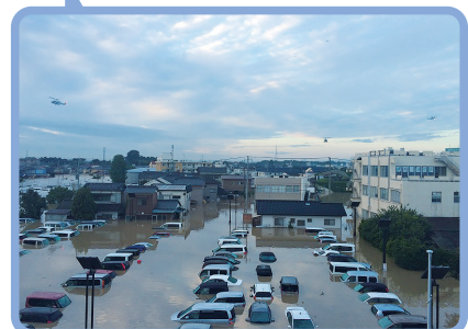
平成27年9月関東・東北豪雨/常総市