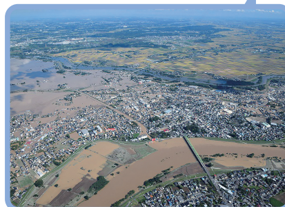
平成27年9月関東・東北豪雨/常総市