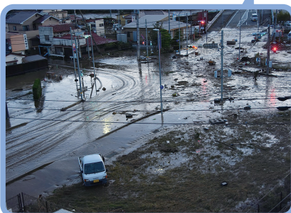
令和元年東日本台風(台風第19号)/大子町