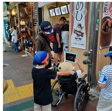
消火栓を確認する様子