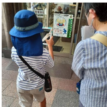
セーフティステーションのステッカーを確認する様子