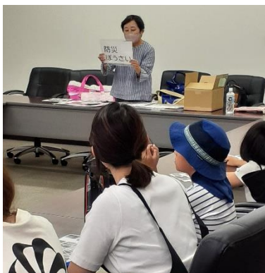
出発前の説明の様子

当支部では、今後も「ぼうさい探検隊」をはじめとした地域の安全・安心に資する取組みを積極的に推進していきます。