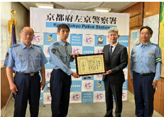
左から、中久保署長、伊東係長、阪口会長、高田交通課長