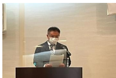
荻野幹事による決議文採択