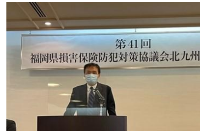
北九州医師会 西理事