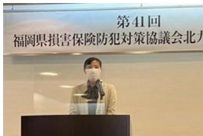
福岡県弁護士会 小倉部会長