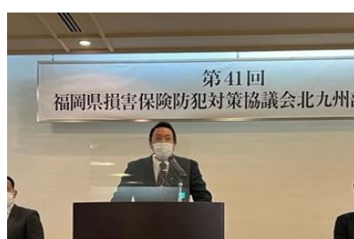
福岡県代協 三島支部長