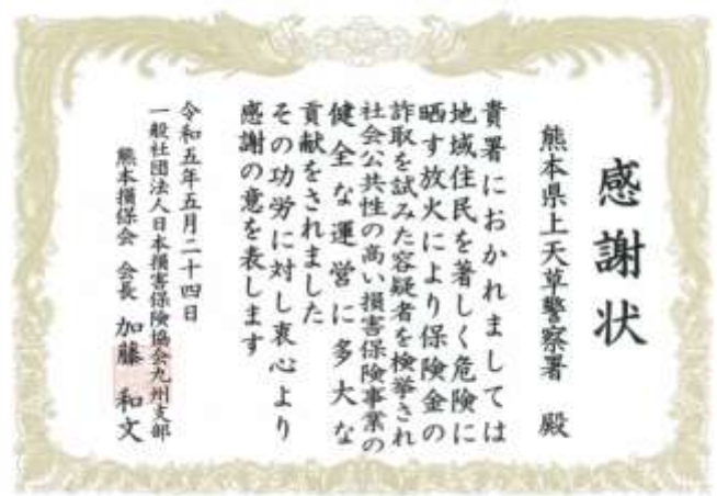
上天草警察署へ贈呈した感謝状