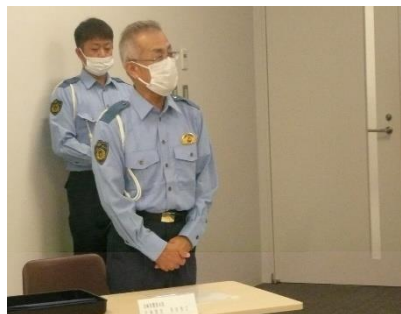
多田交通部長による挨拶