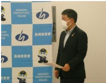
森損保会会長による挨拶

長崎損保会では、引き続き、県警察や関係団体等との連携・協力関係を深めながら、着実に高齢者事故を減減できるよう、交通事故防止活動に取り組んでいきます。