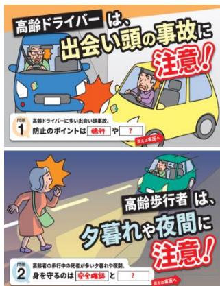
贈呈したチラシデザイン