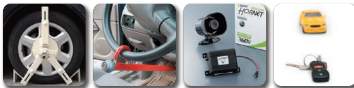
タイヤガード ハンドルロック 警報装置 イモビライザ