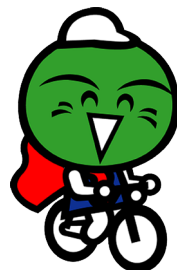
徳島県マスコット 「すだちくん」