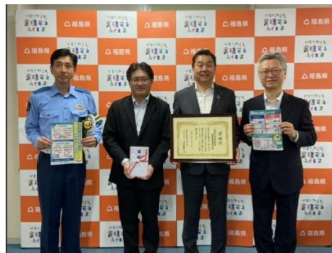
関係者で記念写真 （左は福島県警武藤交通部長）