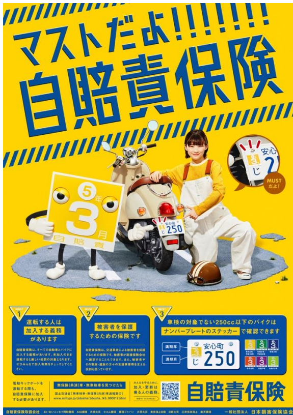
<2022年度自賠責保険広報ポスター>