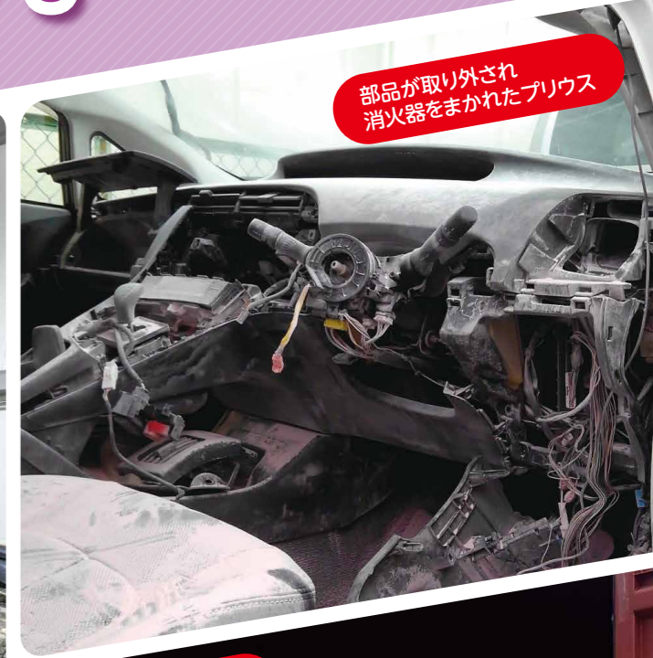
部品が取り外され 消火器をまかれたプリウス