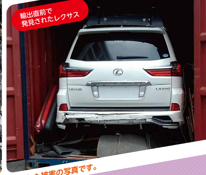
輸出直前で 発見されたレクサス