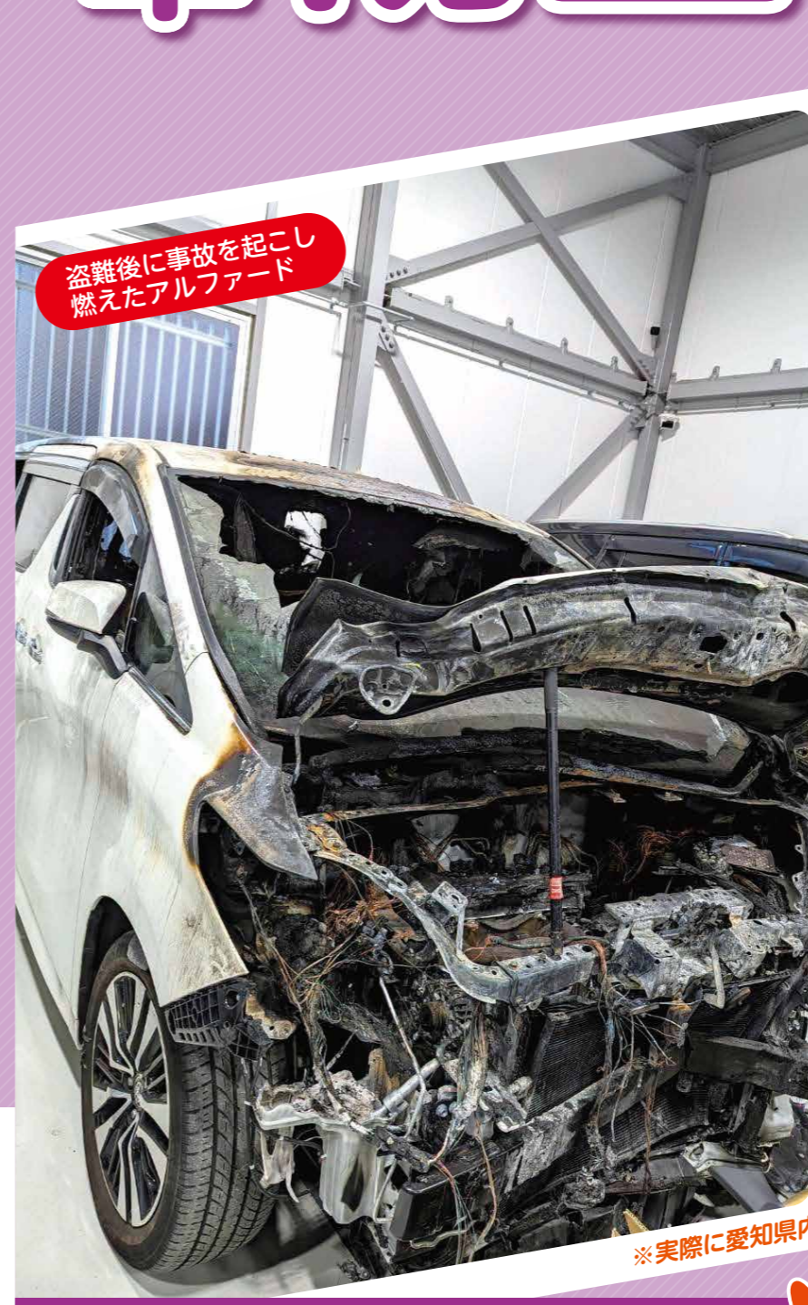
盗難後に事故を起こし 燃えたアルファード

保険の名称、補償範囲、保険料割引対象となる盗難防止装置などは、損害保険会社によって異なります。詳しくは損害保険会社又は損害保険代理店にご照会ください。